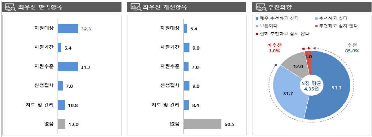
[그림 1] 직장어린이집지원 만족/개선 항목 및 추천 의향